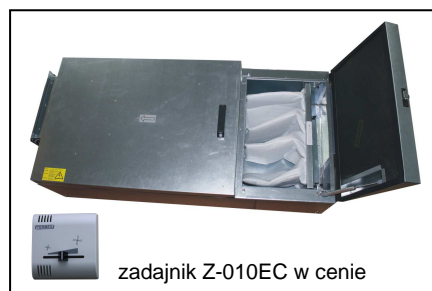
zadajnik Z-010EC w cenie

CN...AQUA-EC...C Posiada okablowanie wewnętrzne, styczniki, transformator 24V oraz listwy zaciskowe. Przystosowana jest do sterowania zewnętrznym sterownikiem AQUA. Odbiorca stosuje własne sterowanie zewnętrzne. Centrala posiada silnik komutowany elektronicznie, sygnałem 0-10V . W cenie zadajnik ścienny Z-010EC (regulacja wydajności wentylatora sygnałem 0-10V, sygnalizacja pracy)